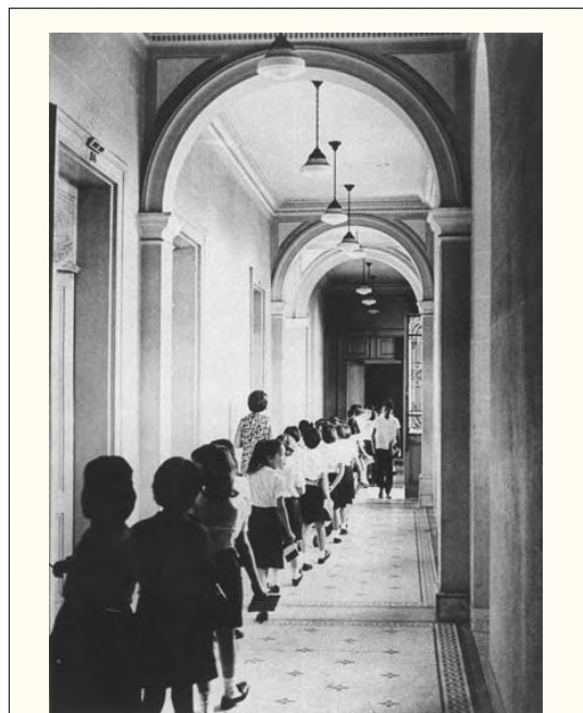
Saída para o recreio (década de 1970) - Foto usada no movimento de resistência à demolição.