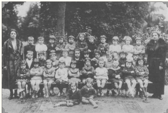
Grupo de alunas do Jardim da Infância, em 1924

A Escola Normal da Capital passou a acolher o Curso Normal para a formação de professores (alunos a partir de 16 anos) e a Escola-Modelo Preliminar "Antonio Caetano de Campos" (7 a 11 anos). Posteriormente, conforme a lei nº 374, de 3 de setembro de 1895, foi instalada a primeira Escola-Modelo Complementar da Capital, para alunos de 11 a 14 anos, destinada a formar professores primários em tenra idade, chamados de complementaristas.