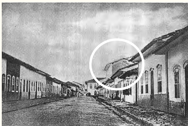
Sobrado da Rua da Boa Morte (atual R. do Carmo) Fonte: Poliantéia comemorativa: 1846-1946; primeiro centenário do ensino normal de São Paulo, s. d.