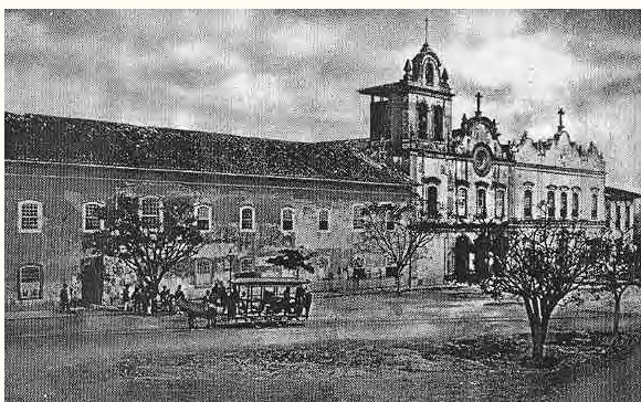
Faculdade de Direito de São Paulo, no Largo de São Francisco - Curso Anexo.