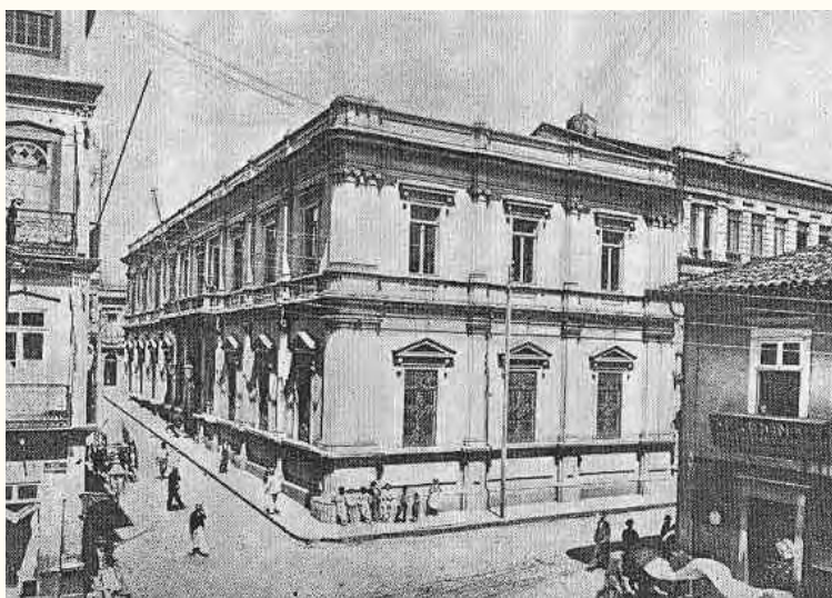
Edifício da Rua do Tesouro – 1880 -1881.

Em virtude do fechamento da escola, em 30 de junho de 1878, tendo em vista o fato de a Assembléia Provincial não ter votado a verba para seu exercício de 1878/1879, os alunos da terceira turma, que deveriam se formar em 1878, não concluíram o curso. Posteriormente, pela lei nº 880, de 6 de outubro de 1903, foram equiparados aos normalistas os alunos que haviam sido aprovados nas matérias do 1º ano e estavam matriculados no 2º ano quando a escola foi fechada. Essa lei era interessante apenas para os alunos que já haviam exercido o magistério primário em grupos escolares ou escolas isoladas públicas do Estado.