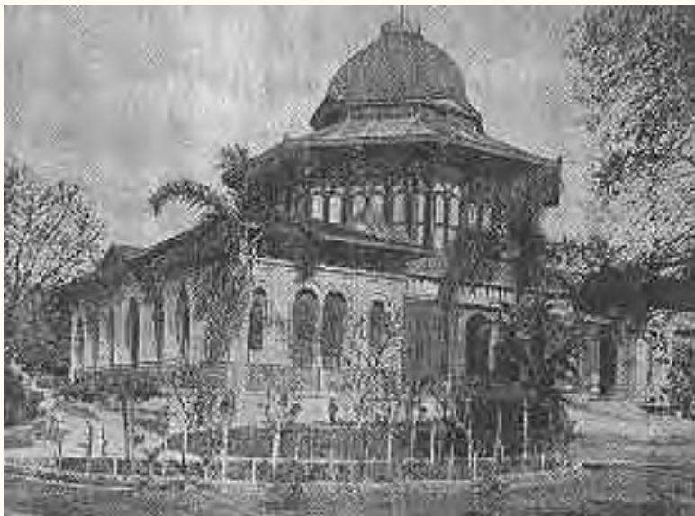
Jardim da Infância, construído atrás da Escola Normal "Caetano de Campos", demolido em 1939.