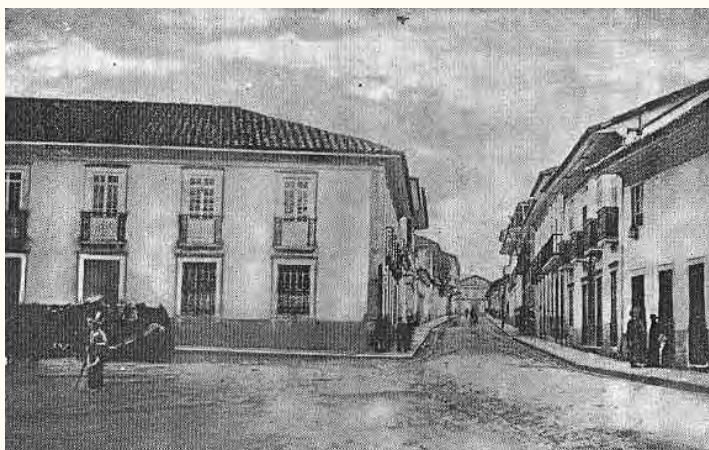
Edifício contíguo à catedral da Sé.

Seu currículo era praticamente idêntico ao das escolas primárias elementares, centrado no conteúdo a ser ensinado. Segundo o Anuário do Ensino do Estado de São Paulo, de 1907/1908, esse currículo contemplava a Gramática (geral e da língua nacional), Aritmética (até proporções), Geometria (noções gerais e aplicações usuais), Caligrafia, Lógica, Religião, além de rudimentar formação pedagógica, com estudos do que no Anuário é chamado de "métodos e processos de ensino, sua aplicação e vantagens comparativas".