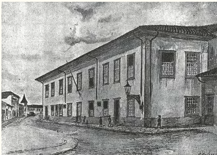
Escola Modelo do Carmo, anexa à Escola Normal de São Paulo, fundada em 17 de Julho de 1890.