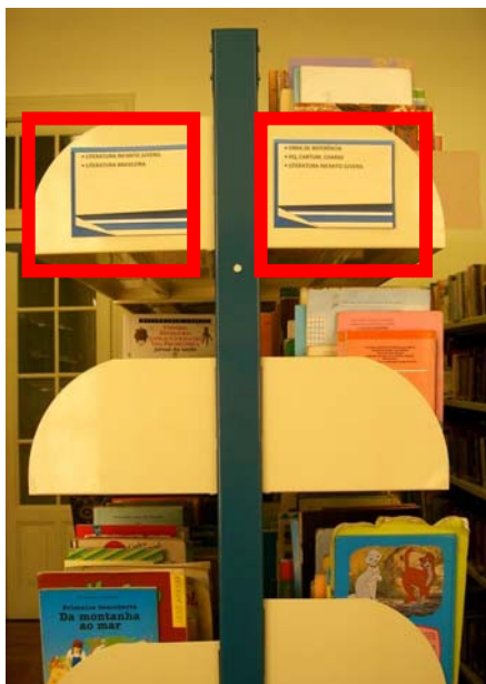
Sinalização das Laterais das Estantes