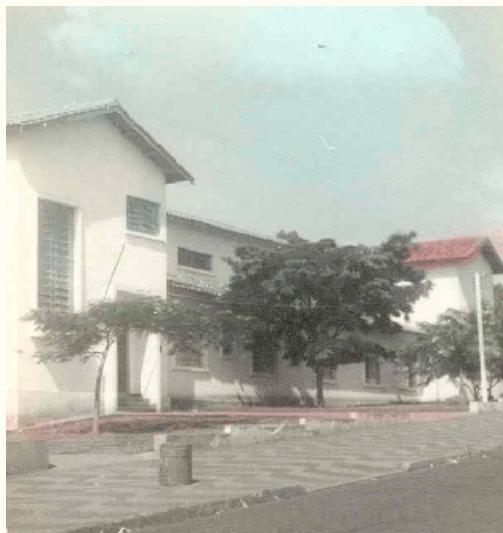
Edifício atual, 1960.

Segundo informações enviadas por sua diretoria em 2003, foi a primeira escola em Campinas a funcionar como Escola Integrada, ou seja, com ensino primário (atual fundamental de 1 a a 4 a série) e o antigo ginásio (5 a a 8 a série do ensino fundamental ).