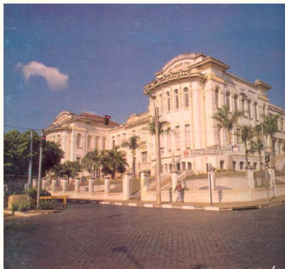
Fonte: Arquitetura escolar paulista: 1890 – 1920 , de Maria Elizabeth Peirão Corrêa, et al. 1991

Foi instalada em 1º de maio de 1911, em prédio provisório.