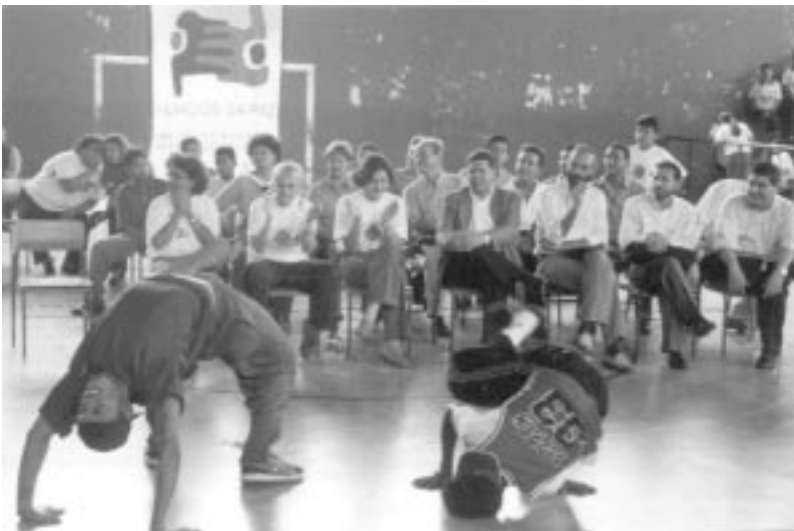
Apresentação de dança de rua.

Cada povo tem seu conhecimento, sua forma de pensar, seu conjunto de valores, suas tradições, que devem ser internamente fortalecidos, mas respeitando e compreendendo a cultura dos outros.